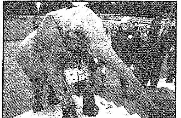
Olifant Mausie op de trappen van het bordes van paleis Soestdijk.

De prins is optimistisch over de toekomst van de natuur. „We moeten blijven hameren en vechten. We moeten gezamenlijk, zowel in Europa als in de landen daarbuiten, veel geld en energie besteden aan het beheer van de natuur en het milieu. Langzaam begint de man in de straat dat ook steeds beter te beseffen. En als een volk eenmaal zegt: dit móet gebeuren, dan wordt het ook de prioriteit van de politici en dan gebeurt het dus ook. Volkeren moeten, bij wijze van spreken, net als met een referendum in de Sowjet-Unie heel duidelijk laten weten wat ze willen: een leefbare aarde, nu! Niet in één land, maar internationaal. Ik ben er stellig van overtuigd dat ik dat nog beleef”, aldus de prins.